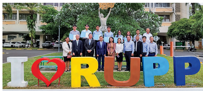
王立プノンペン大学