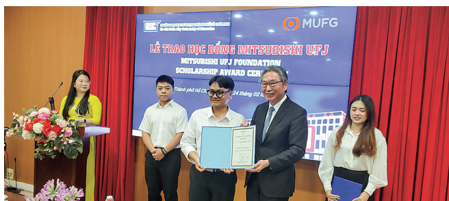
ホーチミン教育大学